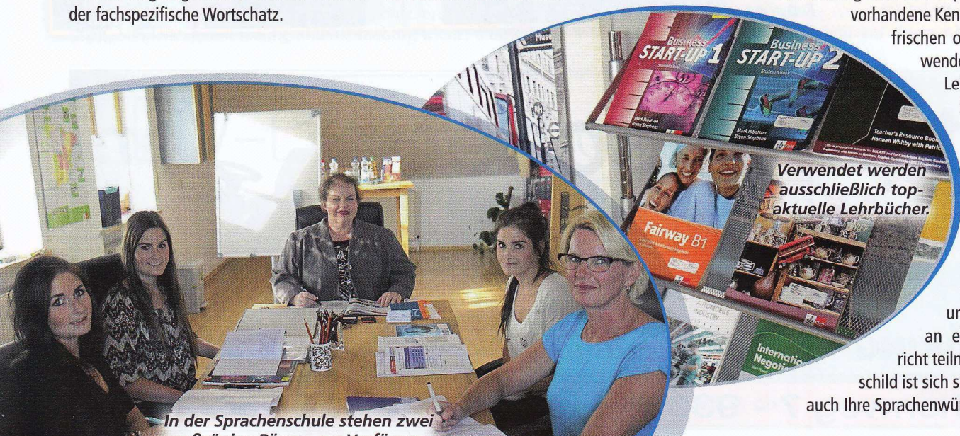
In der Sprachschule stehen zwei